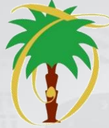
جائزة الملك عبدالعزيز للجودة King Abdulaziz Quality Award